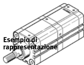
Esempio di rappresentazione

Tipo in esaurimento. Disponibile fino al 2010.