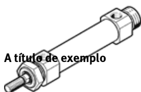
A título de exemplo