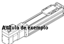
Exemplo de título