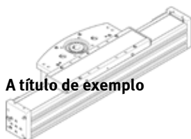
A título de exemplo