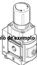
A título de exemplo