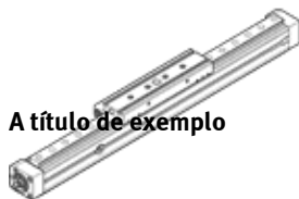
A título de exemplo

Produto será descontinuado. Disponível até 2019. Produto alternativo no Support Portal..