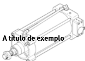
A título de exemplo

com posicionador eletropneumático integrado, de dupla ação, diâmetro do êmbolo 125 mm, interfaces de fixação conforme ISO 15552 no cabeçote dianteiro e traseiro, conexão elétrica/pneumática por soquete tipo flange de metal e cabo de conexão NHSB (acessórios), 4 fios, fonte de alimentação de 24 V CC, entrada de valor nominal 4...20 mA, transmissão de posição 4...20 mA, posição de segurança da haste estendida.