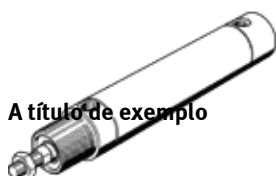
A título de exemplo

O tipo -S6 (resistente à temperatura) não foi projetado para o contato direto com gêneros alimentícios devido às vedações e lubrificações utilizadas.