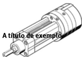
A título de exemplo

para detecção sem contato direto. Movimento giratório e linear operados independentes entre si. Movimento giratório de 0° - 270° com ajuste contínuo.