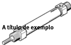
A título de exemplo