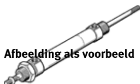
Afbeelding als voorbeeld