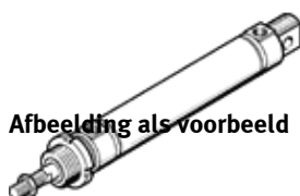
Afbeelding als voorbeeld