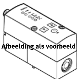
Abbeelding als voorbeeld