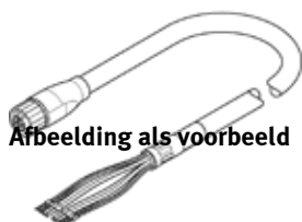
Afbeelding als voorbeeld