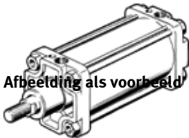
Afbeelding als voorbeeld

Einde productie. Leverbaar tot 2014. Zie het Support Portal voor alternatieve producten.