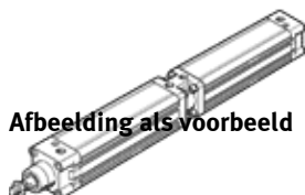
Afbeelding als voorbeeld