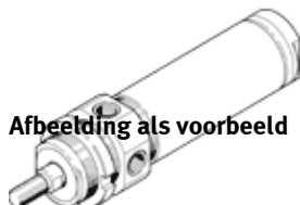
Afbeelding als voorbeeld

corrosiebestendig voor contactloze positiebepaling, met elastische eindslagbuffering. Dit product is enkel via Festo Amerika verkrijgbaar.