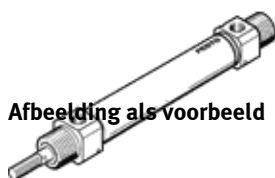
Afbeelding als voorbeeld