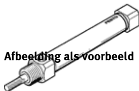
Afbeelding als voorbeeld