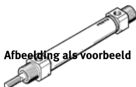
Afbeelding als voorbeeld