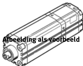
Abbeelding als voorbeeld