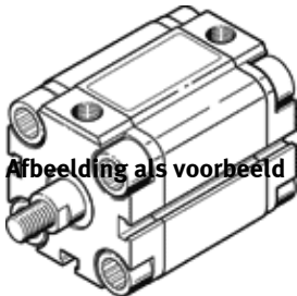
Abbeelding als voorbeeld

voor contactloze detectie (magneet) Zuigerstangeinde met uitwendige schroefdraad Moer voor zuigerstangschroefdraad wordt meegeleverd. Dit product is enkel via Festo Amerika verkrijgbaar. Einde productie. Leverbaar tot 2011.