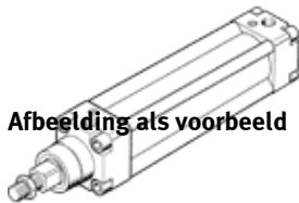
Afbeelding als voorbeeld