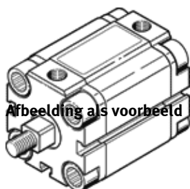
Abbeelding als voorbeeld

Einde productie. Leverbaar tot 2025. Zie het Support Portal voor alternatieve producten.