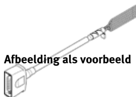
Afbeelding als voorbeeld