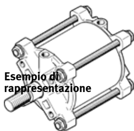
Esempio di rappresentazione