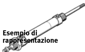
Esempio di rappresentazione