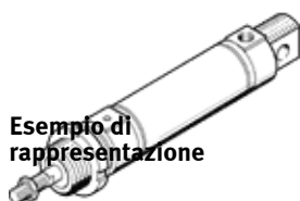
Esempio di rappresentazione

Tipo in esaurimento. Fornibile fino al 2022. Per alternative di prodotto, vedere il Support Portal.