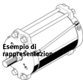
Esempio di rappresentazione

Tipo in esaurimento. Fornibile fino al 2024. Per alternative di prodotto, vedere il Support Portal.