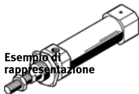
Esempio di rappresentazione

Testata posteriore con attacco di alimentazione assiale rispetto al cilindro. Questo prodotto è ottenibile soltanto tramite la consociata Festo in Corea