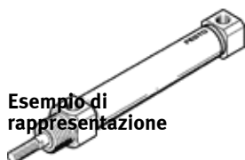
Esempio di rappresentazione