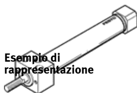
Esempio di rappresentazione