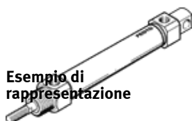
Esempio di rappresentazione

Tipo in esaurimento. Fornibile fino al 2024. Per alternative di prodotto, vedere il Support Portal.