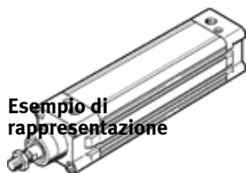
Esempio di rappresentazione

Sono disponibili delle alternative moderne digitando le prime quattro cifre del codice di tipo nel campo di ricerca.