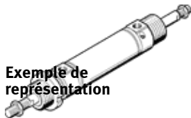
Exemple de représentation