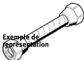
Exemple de représentation

Tenez compte de notre programme de simulation MuscleSim sur le site de téléchargement Internet Festo.