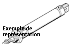
Exemple de représentation