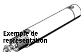
Exemple de représentation

La variante -S6 (résistante à la chaleur) n'est pas prévue pour le contact alimentaire en raison des joints et de la graisse utilisés.