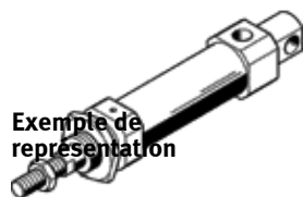
Exemple de représentation

Ce produit est exclusivement disponible via la société Festo Corée