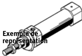
Exemple de représentation

avec culasse arrière avec raccord d'air axial à l'axe du vérin. Ce produit est exclusivement disponible via la société Festo Corée