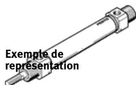
Exemple de représentation

Ce produit est exclusivement disponible via la société Festo Corée