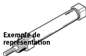
Exemple de représentation