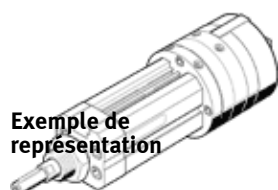
Exemple de représentation