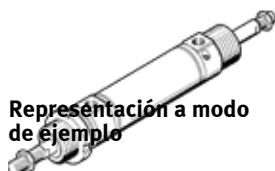
Representación a modo de ejemplo