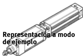
Representación a modo de ejemplo