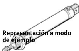
Representación a modo de ejemplo