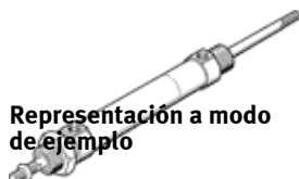
Representación a modo de ejemplo