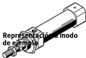
Representación en modo de ejemplo

Culata trasera con conexión de aire axial al eje del cilindro. Este producto se puede adquirir únicamente a través de Festo Corea.