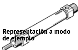
Representación a modo de ejemplo