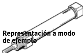
Representación a modo de ejemplo